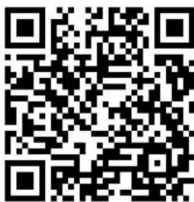
การทำสัญญาเข้าเป็นนักเรียนนายเรือ

๑.๒ นตท.บันทึกรายละเอียดข้อมูลการทำสัญญาแบบออนไลน์ทางเว็บไซต์ http://www.rtna.ac.th หัวข้อ”การทำสัญญาเข้าเป็นนักเรียนนายเรือ” ตามลำดับขั้นตอนให้เสร็จสิ้น ใน ๑๔ ก.พ.๖๗